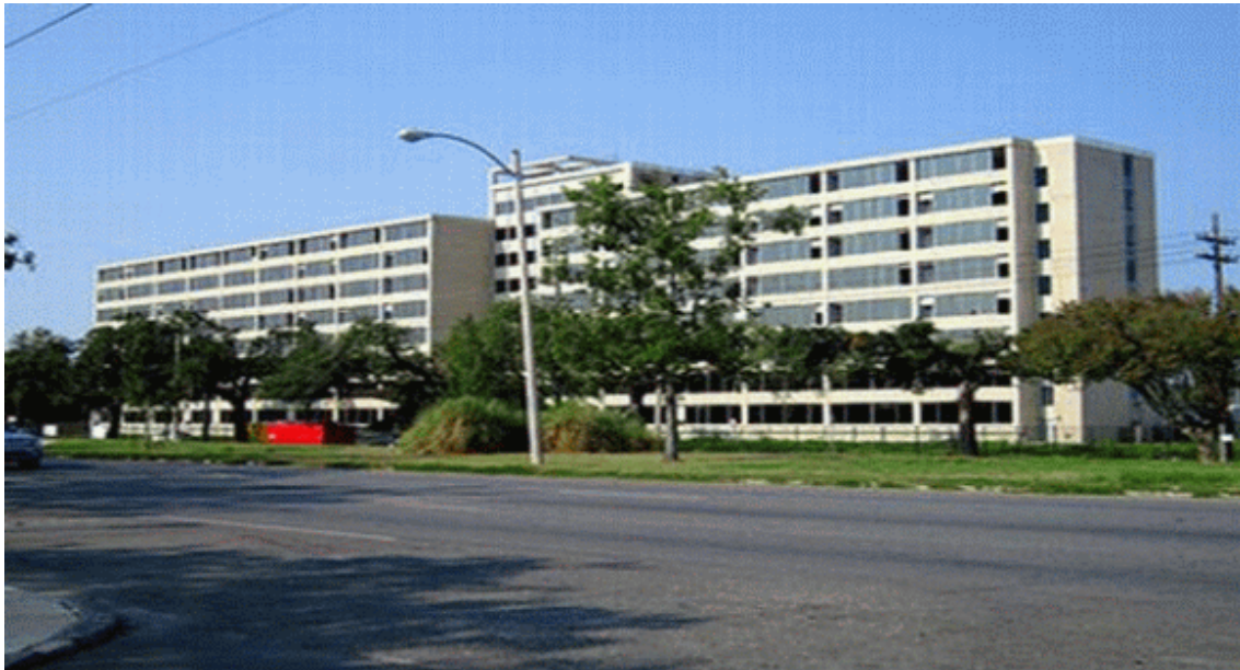
Rosen House in 1990

I recommend you to close the FBI office in New Orleans and to build a new office with new people. The FBI office in New Orleans has to pay for building again the Rosen House. You may consider these actions as one of the measures for prevention of future damages.